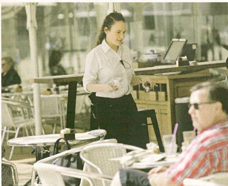
מלצרית בבית קפה. נקבע כי הטיפים ייחשבו כהכנסה של המסעדה